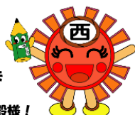
西ぴかちゃん メインマスコットキャラクター 明るく元気にみんなを照らすよ！