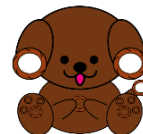
くつわん くつわのモチーフが自慢！